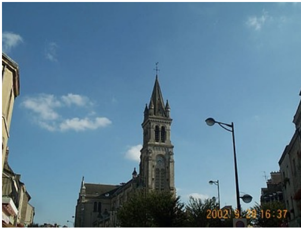
Azimut de la prise de vue : 160 gr